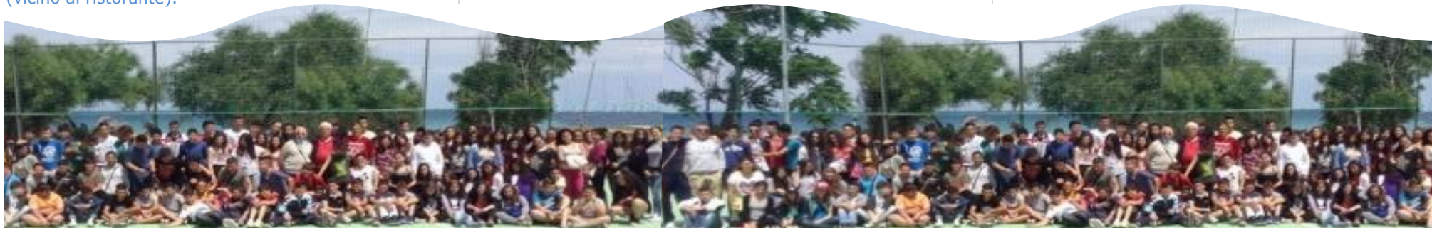
VILLAGGIO FARO PUNTA STILO - GUARDAVALLE MARINA (CZ) - 30 MAGGIO - 4 GIUGNO 2017

Ecco, dunque, la riproposizione del progetto "Un anno di sportinsieme" che si si concluderà con il campus conclusivo della stagione a Guardavalle Marina dal 30 maggio al 4 giugno 2017 all'insegna di "Sportinsieme days" e per una continuità stabile di collegamento al Meeting dello Sport.